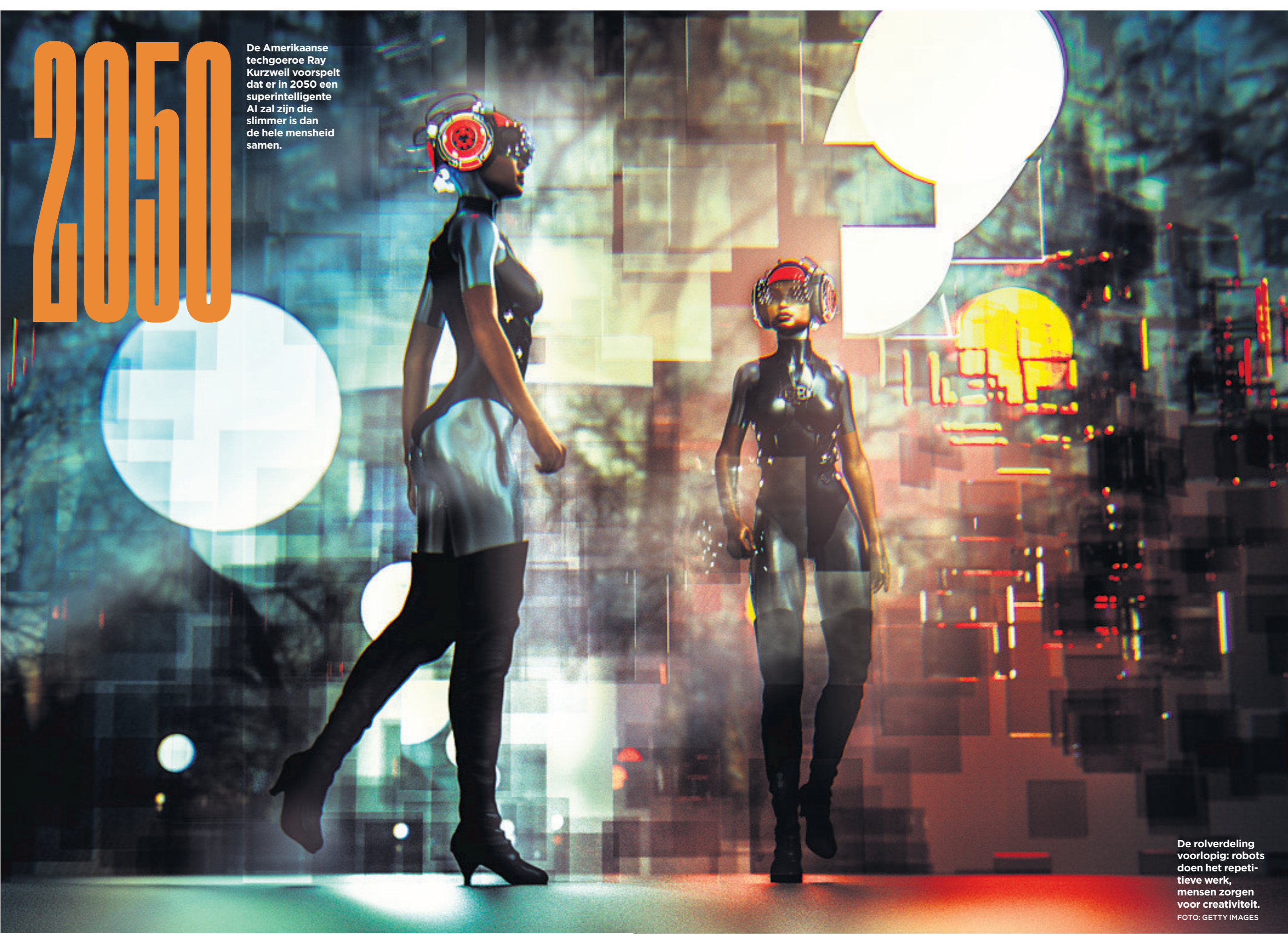
De Amerikaanse techgoeroe Ray Kurzweil voorspelt dat er in 2050 een superintelligente AI zal zijn die slimmer is dan de hele mensheid samen.

Het is een stelling die met enig enthousiasme door Wognum wordt onderschreven. 'Ik begrijp de hype wel, het is ook een prachtig onderwerp om 's avonds in de kroeg vanachter je bier over te filosoferen. Dat deed ik met mijn studiegenoten eind jaren negentig ook. Maar zelfdenkende robots met een bewustzijn blijven nog heel lang sciencefiction. Dat komt doordat we nog steeds niet weten hoe ons brein precies werkt. Wij kunnen dingen die wiskundige algoritmen voorlopig niet kunnen. Het is wel geprobeerd, door het koppelen van meerdere neurale netwerken bijvoorbeeld. De gedachte was dat er dan vanzelf bewustzijn ontstaat. Maar nee, ons begrip van hoe hersenen werken, schiet bijlijkbaar tekort. En daarbij: wat is bewustzijn eigenlijk? En wat is vrije wil? We weten het niet. Hoe kun je het dan na-