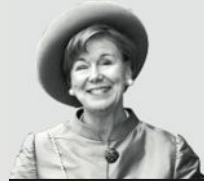
Christina van Oranje-Nassau Tante van

GEVOLG De zaak loopt nog; vermoedelijk een naheffing plus boete.