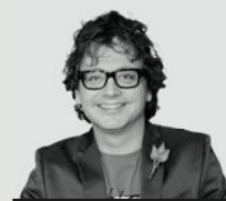
Guus Meeuwis Zanger